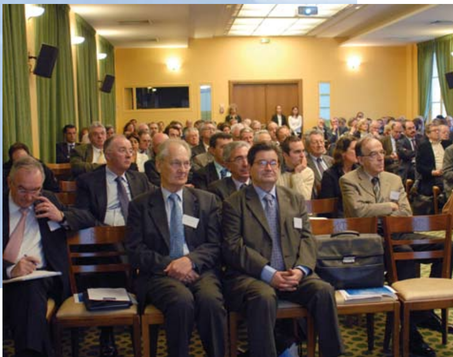
“Vers une approche globale des territoires et des ressources.”